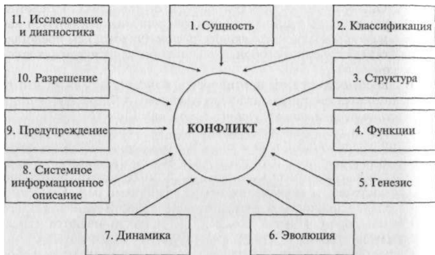
Схема 4. Универсальная схема понятийного описания конфликта

Затем им же была предложена система, включающая одиннадцать понятийно-категориальных групп описания конфликта. Для всех наук, изучающих конфликт, можно предложить следующий вариант, куда входят одиннадцать основных категориальных групп: сущность, классификация, структура, функции, генезис, эволюция, динамика, системно-информационное описание, предупреждение, разрешение конфликта, диагностика и исследование (схема 4).