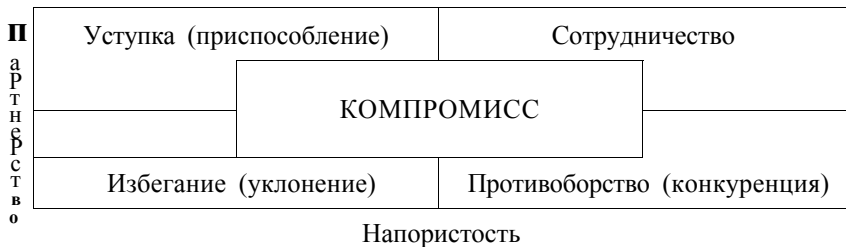
Схема 2. Стили поведения в конфликте

приумножения общих интересов. «Наш интерес состоит в том, чтобы наилучшим образом обеспечить интересы другой стороны» — провозглашают сторонники партнерской стратегии поведения.